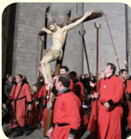
Image de Jésus Crucifié

ARCHICONFRÉRIE DU SANG TRÈS PUR DE NOTRE SEIGNEUR JÉSUS-CHRIST