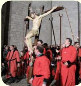
Imagen de Jesús Crucificado

ARCHICOFRADÍA DE LA PURÍSIMA SANGRE DE NUESTRO SEÑOR JESUCRISTO