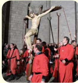
Bild von Jesus am Kreuz

BRUDERSCHAFT DES REINEN BLUTES UNSERES HERRN JESU CHRISTI