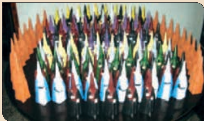
Figures de fang que reproduïxen els diferents confreres. Hi ha figures pintades i sense pintar. Original dissenyat per l'artista gironina Ció Avellí.

La Junta de Confraries de Girona, amb l'ànim de donar difusió, així com de popularitzar-los ha editat una sèrie d'objectes que exposa en aquesta pàgina i que es poden adquirir durant la Setmana Santa a l'exposició de l'església dels Dolors i a la parada que s'instal·larà el dissabte 13 d'abril, a la Rambla i el Divendres Sant, dia 18 d'abril a la plaça de la Catedral.