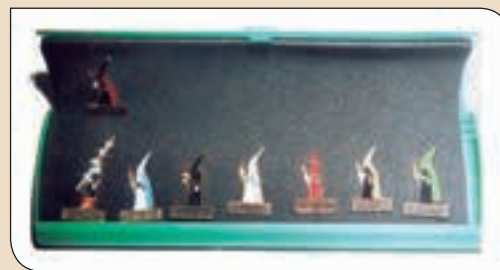
Estoig recopilatori de tots els Pins dels diferents confreres que s'han editat.