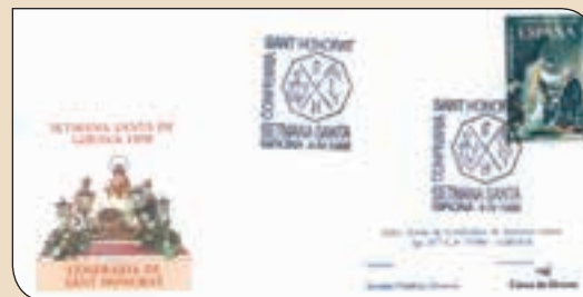
Sobres amb matasegells oficials, concedits per la Direcció General de Correus i Telègrafs.