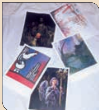
Litografies signades pels diferents autors dels Cartells de Setmana Santa.